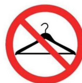
Vestiaires fermées Wardrobe closed