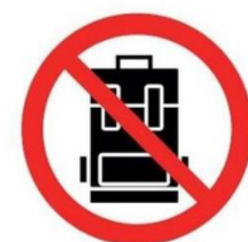
Pas d'objets encombrants No large items