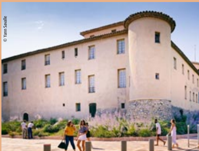
Musée Magnelli, musée de la céramique

Place de la Libération - Vallauris • 13 juin > 28 septembre