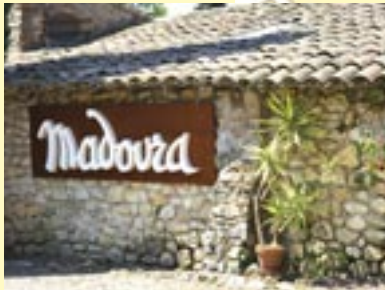
Poterie Madoura Chiuso per lavori di rinnovamento. Geschlossen für Reparaturen.

Novità: primavera 2023 Neu: Frühjahr 2023 Inaugurazione di una mostra dedicata a Jean Marais. Eröffnung der Ausstellungs- und Gedenkstätte, die Jean Marais gewidmet ist.