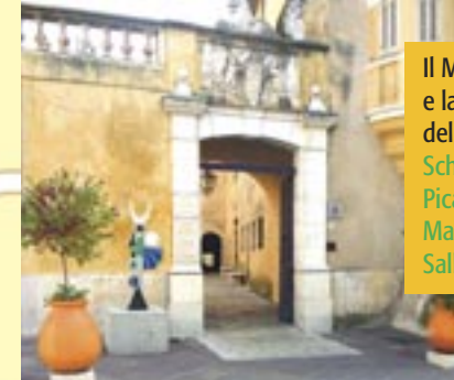
Il Museo Nazionale Picasso "la Guerra e la Pace", Museo Magnelli, Museo della Ceramica - Salle Eden Schlossmuseum Nationales Picassomuseum "Krieg und Frieden" Magnellimuseum, Keramikmuseum Salle Eden

Viale Clemenceau e strade vicine : circuito artisti, artigiani, vasi, ceramisti, laboratori, botteghe e gallerie d'arte. Avenue Clemenceau und die benachbarten Strassen: Rundweg, Künstler, Poterien, Keramisten, Ateliers, Boutiquen und Kunstgalerien.