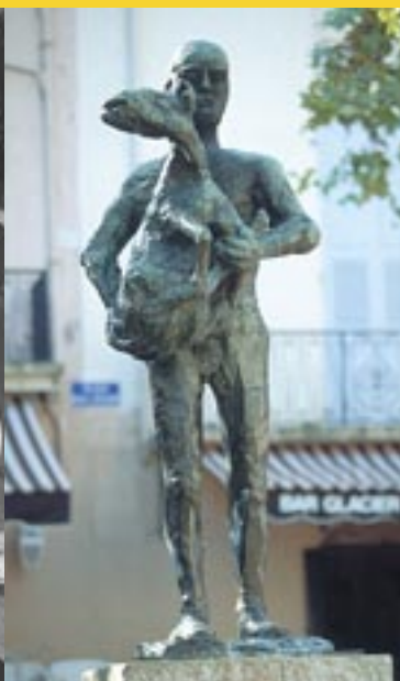
Statue de l'Homme au Mouton Picasso