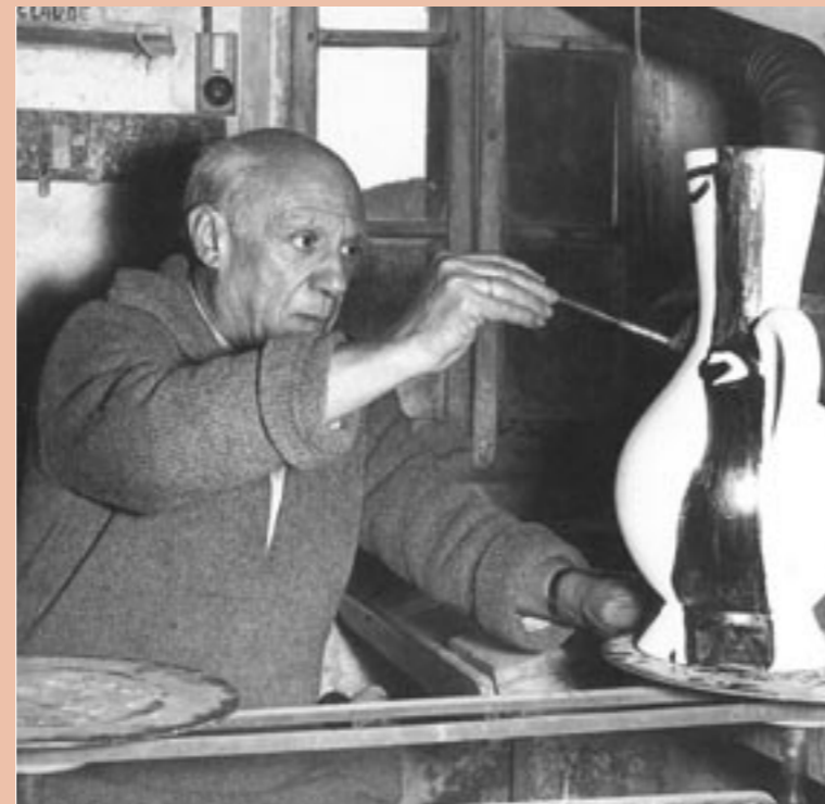
illustration : Picasso chez Madoura

Ouvert de 10h30 à 13h00 et de 15h00 à 19h00 Fermé dimanche après-midi et lundi - Entrée libre